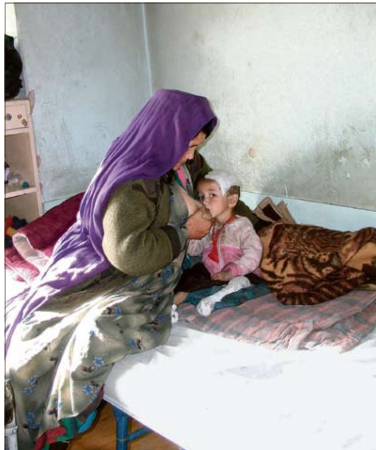
Tulikuumaan lattiakuoppauniini putoaminen on tavallinen tapaturma pienille lapsille, kuten tässäkin tapauksessa. Äidin maito on vielä tarpeen.